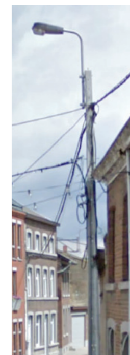
Exemple d'appareils de type «fonctionnel haut sur mât» et «en console»