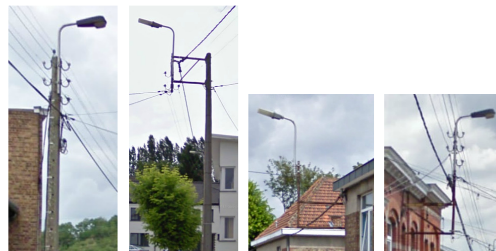
Exemple d'appareils de type «fonctionnel haut sur mât» et «en console»