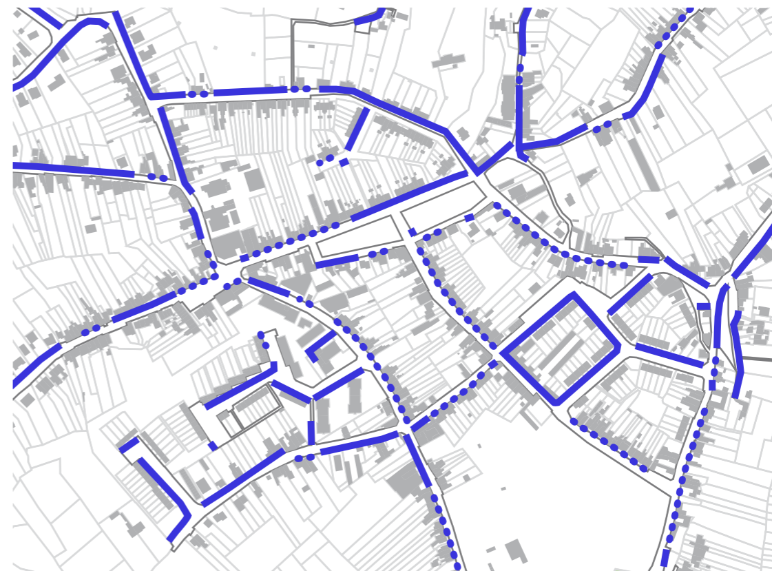
Carte des implantations