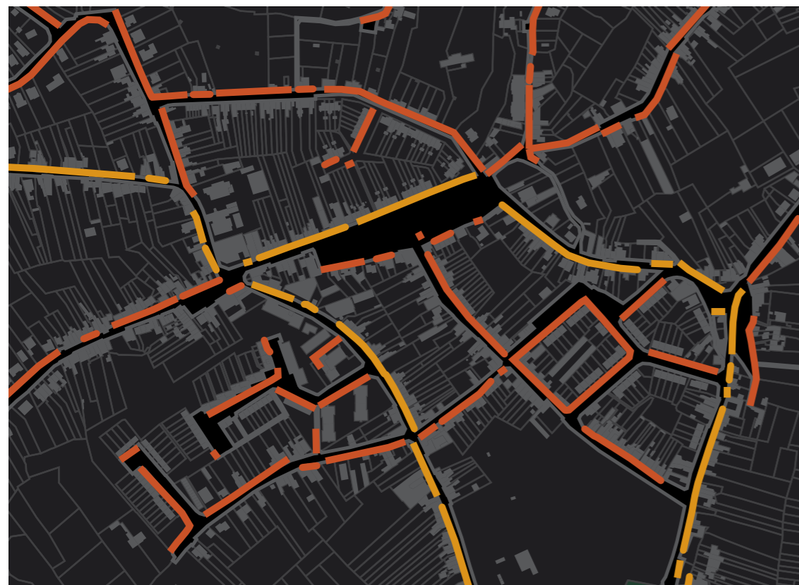
Carte des tonalités

Remarque : Manque d'éclairage public au niveau de la place arborée J. Wauters.