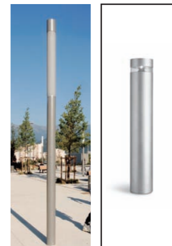
Eclairage de la centralité : Colonnes type PHYLOS et bornes type iWAY

Matériel type «espace singulier» suggéré