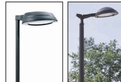
Eclairage général des voiries : Type CITY SOUL ou MAYA