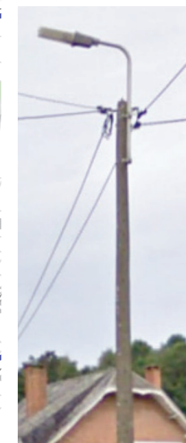
Exemple d'appareils de type «fonctionnel haut sur mât»