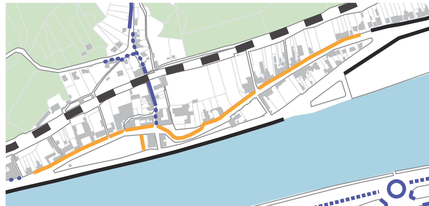
Carte des implantations