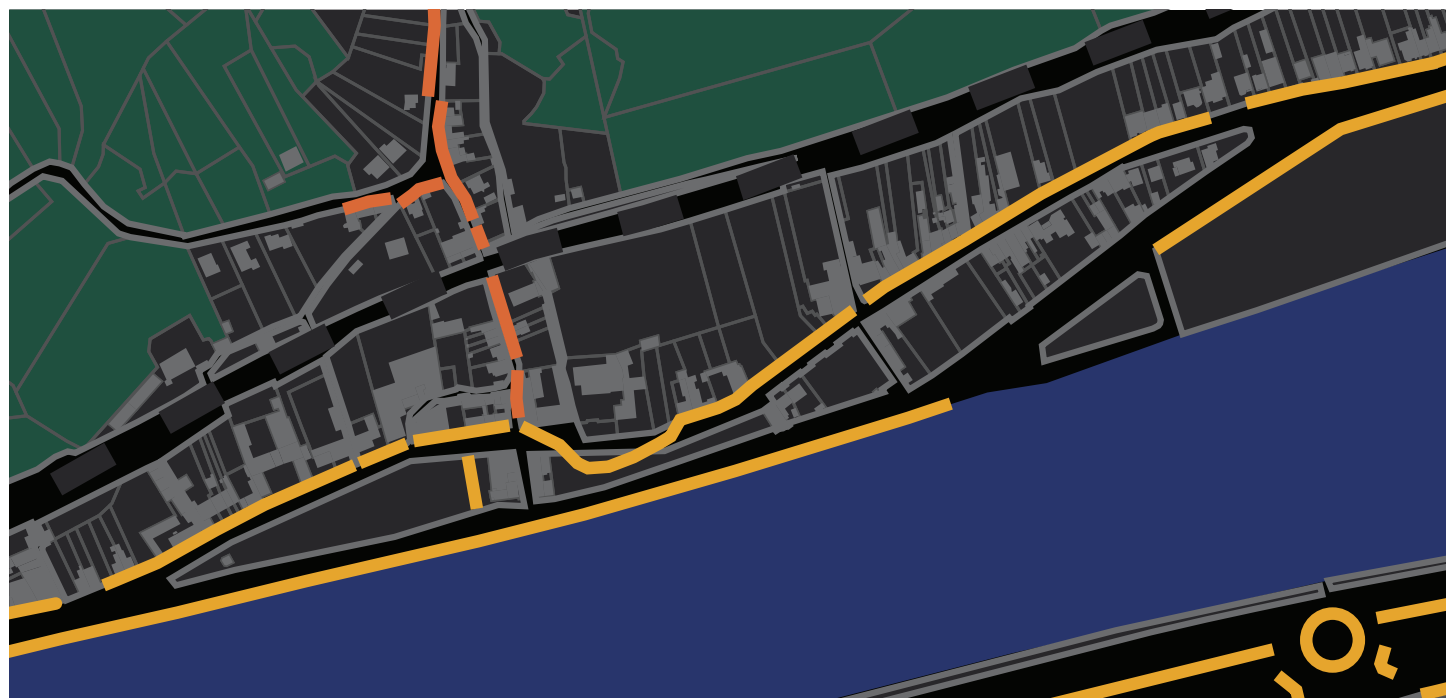
Carte des tonalités

NB: Seul le village de Chokier possède un matériel d'éclairage public propre au village qui permet de l'identifier.