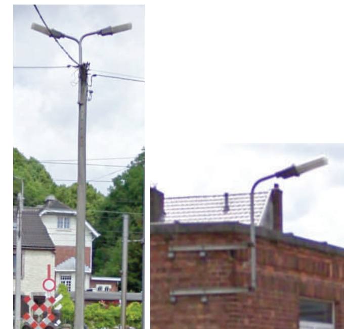
Exemple d'appareils de type «fonctionnel haut sur mât» et «en console»