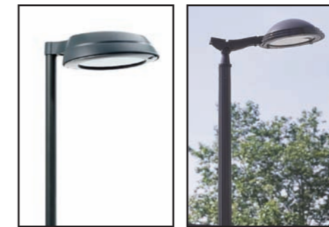
Eclairage de la chaussée de Ramioul (pour continuité avec Ramet) : Type CITY SOUL ou MAYA