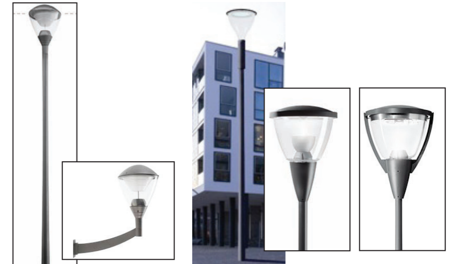
Eclairage général des voiries : Type KIO ou METRONOMIS (Metronomis LED, Anney ou Berlin)

Matériel type «espace singulier» suggéré