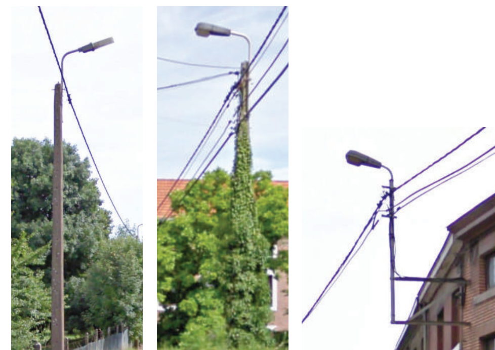
Exemple d'appareils de type «fonctionnel haut sur mât» et «en console»