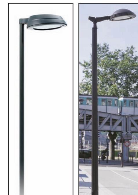
Eclairage général des voiries et de la centralité : Type CITY SOUL ou MAYA