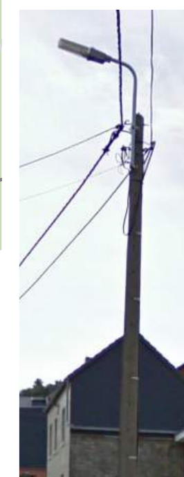
Exemple d'appareils de type «fonctionnel haut sur mât»