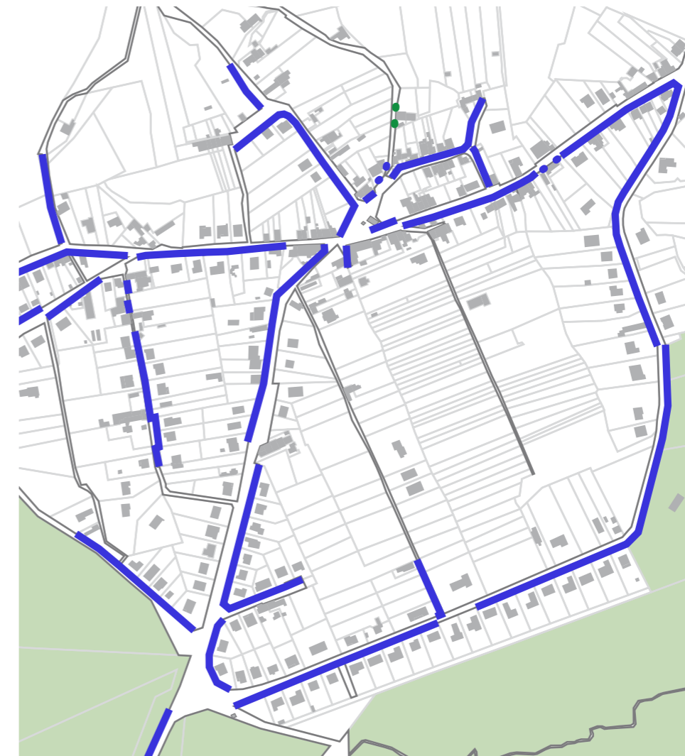
Carte des implantations