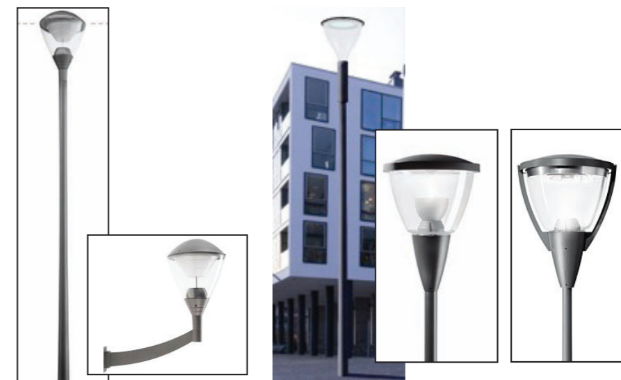
Eclairage de la Cité Blanche : Type KIO ou METRONOMIS (Metronomis LED, Annecy ou Berlin)