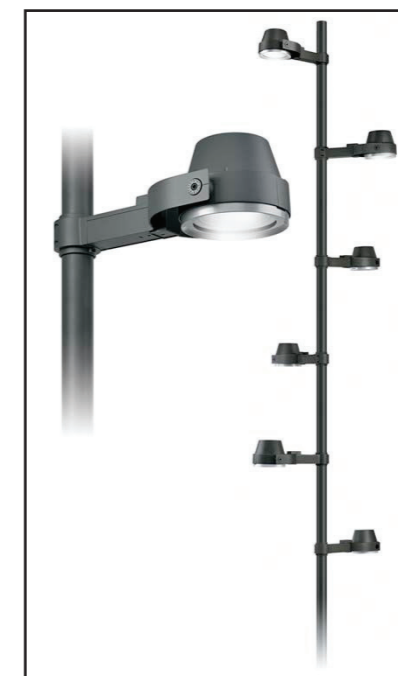
Eclairage de la centralité : Multi-projecteurs type URBANSCENE