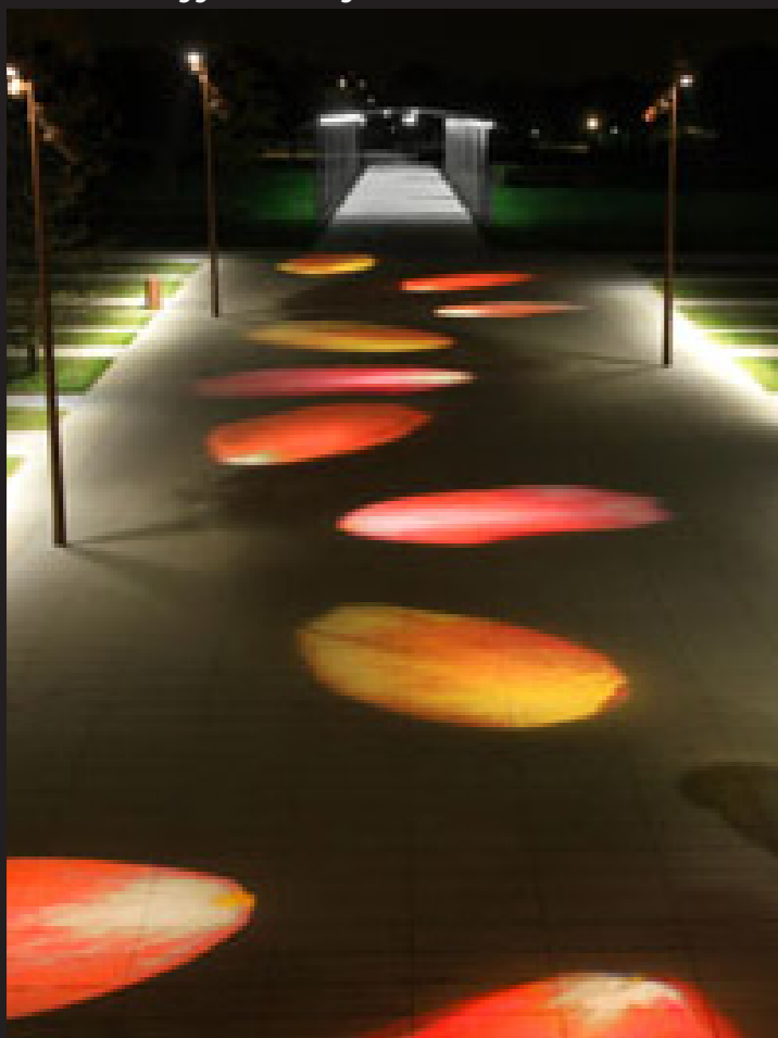
Ambiances suggérées (images de référence)

Nous recommandons que tous les sites scolaires de la commune profitent de telles installations, avec un langage commun, dans le but de créer un «fil rouge» sur tout le territoire. Les motifs projetés peuvent bien sûr différer d'un endroit à l'autre, faisant par exemple l'objet d'une participation des élèves ou des habitants du quartier.