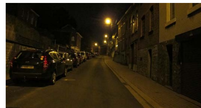
Rue de Flémalle-Grande