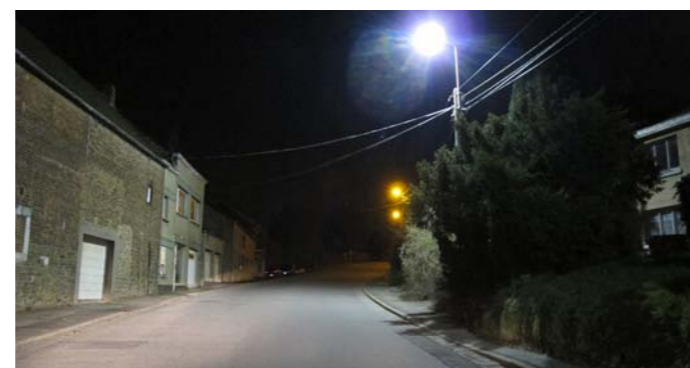
Rue de Warfusée