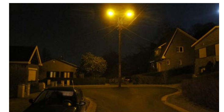
Rue F. Chefnay