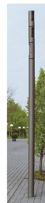
Eclairage des 3 centralités : Multi-projecteurs type MODULLUM

Matériel type «espace singulier» suggéré