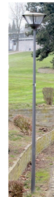
Eclairage des chemins piétons : Type MELANTHIA car déjà existant dans l'entité

Matériel type «espace singulier» suggéré