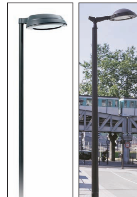
Eclairage général des voiries : Type CITY SOUL ou MAYA