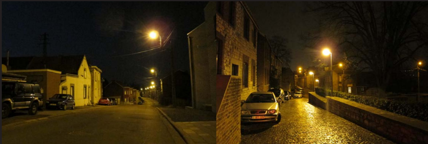
Impressions lumineuses suggérées (images de référence)