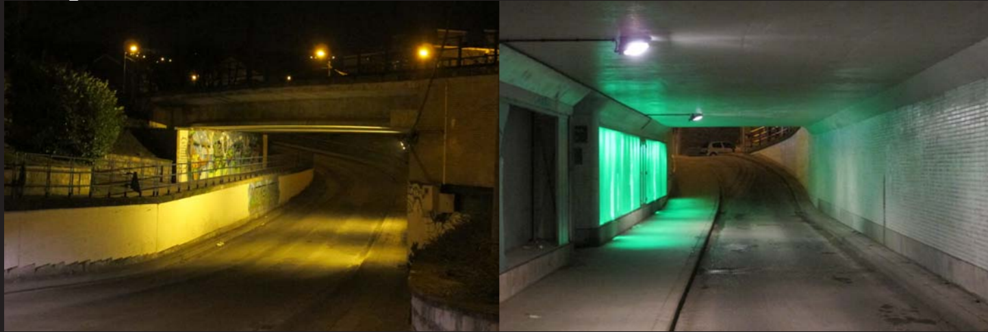
Impressions lumineuses suggérées (images de référence)