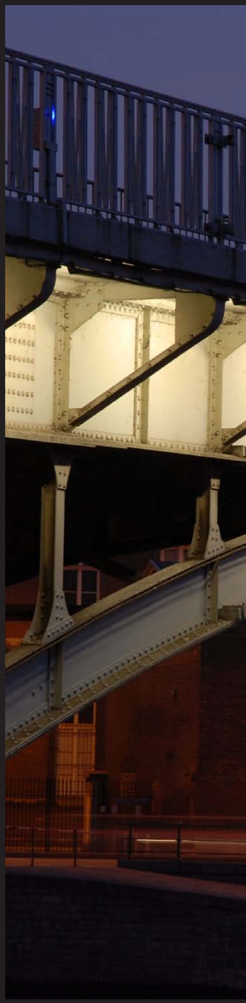
Illumination de la Passerelle à Liège (B), Radiance35 (2006)